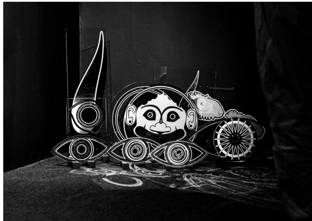
fotografije Vanja Babić

Nagovoreni bakrom povezujemo značenja; Meduza je navodno kosom zavela Atenina ljubavnika, pa joj je kosa za kaznu pretvorena u zmije, a ona slijedom toga u monstruma. Glavni adut privlačnosti postaje čimbenikom nakaznosti, težište je stavljeno na estetiku, ona je prepoznata kao plan na kojem je osveta najefikasnija. Time je na razini mita, po Ateninu mišljenju, ljepota izdvojena kao ključno žensko oružje. Muškarci, međutim, poučeni Odisejem, znaju da, osim ljepotom, žene zavode i pjesmom, to im je također snažno oružje.